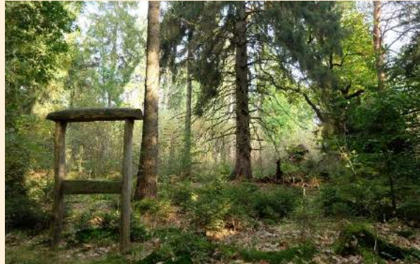
Der Blick fürs Detail wird durch natürliche Rahmen geschärft.

Begleiten Sie Luca, den Hirschkäfer, auf seinem Rundweg und folgen ihm durch landschaftliche und historische Besonderheiten, verschiedene Schutzgebiete und sehenswerte Einzelbiotope.