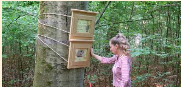
Das Waldlabyrinth -ein Spaß für große und kleine Waldfreunde

Auf unserem Naturlehrpfad schärfen natürliche Holzrahmen an den unterschiedlichen Haltepunkten den Blick fürs Detail. Die wissenswerten Informationen zu den Einzelpunkten finden Sie in der Begleitbroschüre, die im Waldmuseum erhältlich ist. Die Wanderung beginnt am Naturum und dauert gute zwei Stunden. Hier ist zudem auch unsere Broschüre “Die Gührde” erhältlich.