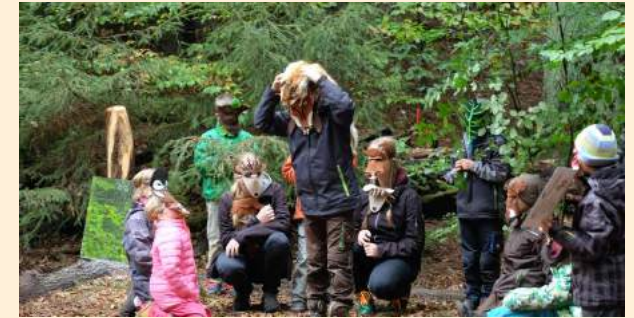
Auf der Waldbühne darf gespielt werden.

In der Gührde gibt es das erste Waldtheater in Niedersachsen. Das innovative waldpädagogische Konzept richtet sich an Schulklassen und andere Jugendgruppen und hilft den jungen Waldbesuchern spielerisch ein tiefes Verständnis für den Wald und seine Bewohner aufzubauen.