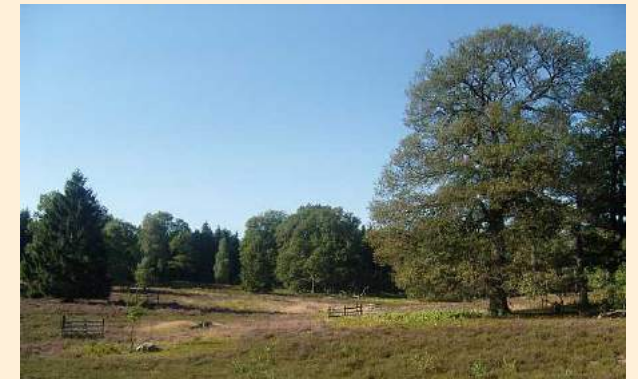
Der Breeser Grund - ein Stück Gührde mit besonderem Reiz

In der Gührde gibt es das erste Waldtheater in Niedersachsen. Das innovative waldpädagogische Konzept richtet sich an Schulklassen und andere Jugendgruppen und hilft den jungen Waldbesuchern spielerisch ein tiefes Verständnis für den Wald und seine Bewohner aufzubauen.